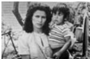
Los motivos de Luz (1985)