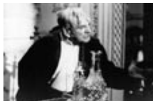
Su Alteza Serenísima (2000)