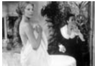
La Güera Rodríguez (1977)