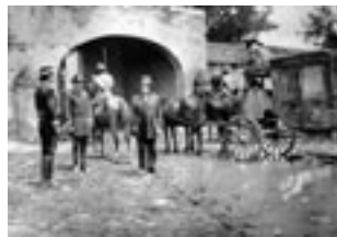
Aquellos años (1972)