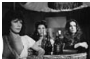
Las siete Cucas (1980)