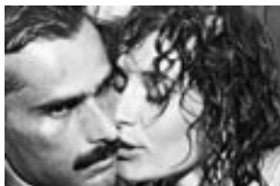
La furia de un dios (1987)