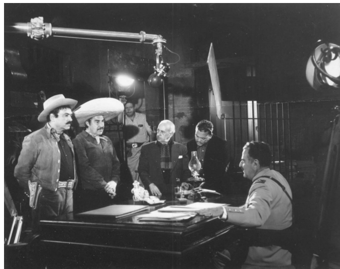
Pedro Armendariz, Emilio "indio" Fernández y Roberto Rodríguez